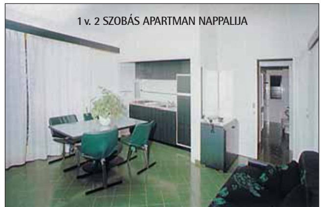
1 v. 2 SZOBÁS APARTMAN NAPPALJA