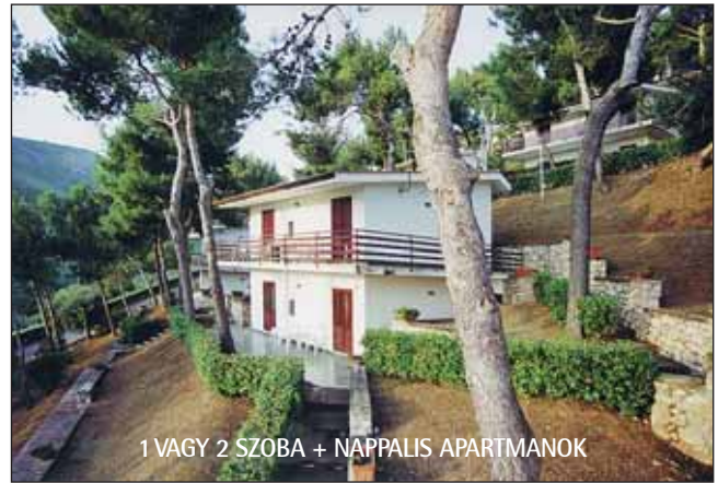
1 VAGY 2 SZOBA + NAPPALIS APARTMANOK

Kapacitás: 14 db 2-3 fős stúdió, 3 db 3-5 fős, 1 sz. + n., 3 db 4-6 fős, 2 sz. + n. (Az online-foglalásban lévő szobaszámok tájékoztató jellegűek.)