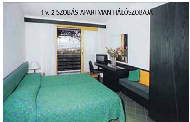
1 v. 2 SZOBÁS APARTMAN HÁLÓSZOBÁJA