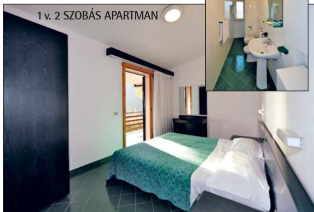
1 v. 2 SZOBÁS APARTMAN