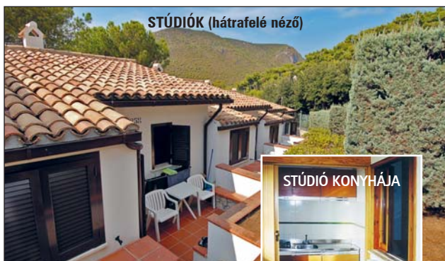
STÚDIÓK (hátrafelé néző)