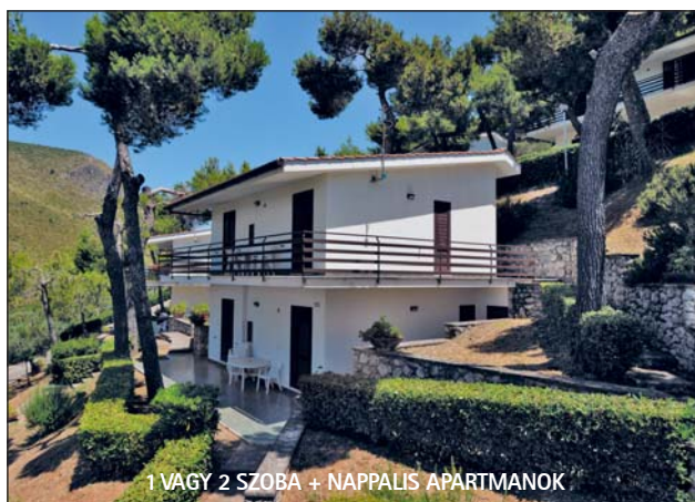
1 VAGY 2 SZOBA + NAPPALIS APARTMANOK