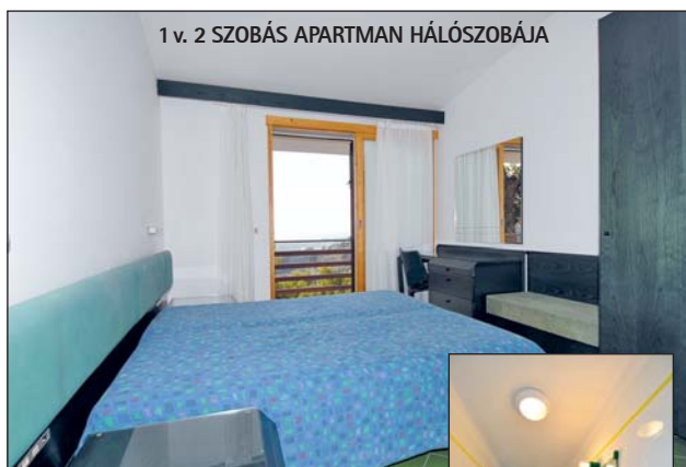
1 v. 2 SZOBÁS APARTMAN HÁLÓSZOBÁJA