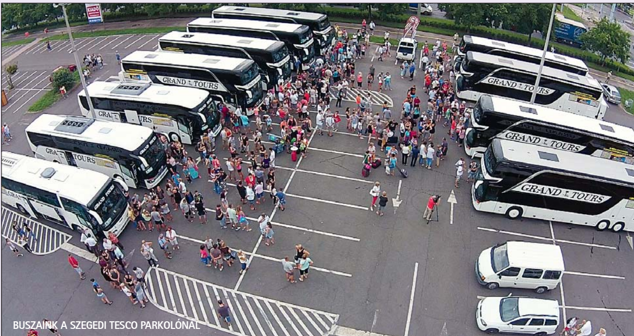
BUSZAINK A SZEGEDI TESCO PARKOLÓNÁL