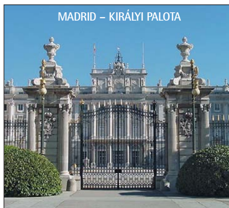
MADRID – KIRÁLYI PALOTA

Fakultatív programok (Ft/fő): Róma 3000 Ft, Nápoly (Capri) 3000 Ft, Pompei–Vezúv–Sorrento 4000 Ft, Cassino 1000 Ft.