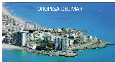
OROPESA DEL MAR

Fakultatív programok (Ft/fő): Madrid–Toledo 8000 Ft, Barcelona 5000 Ft, Valencia 2500 Ft, Peniscola 1500 Ft, Port Aventura (Disneyland) 3500 Ft+belépő. A megadott dátumok előtti napon van az indulás!