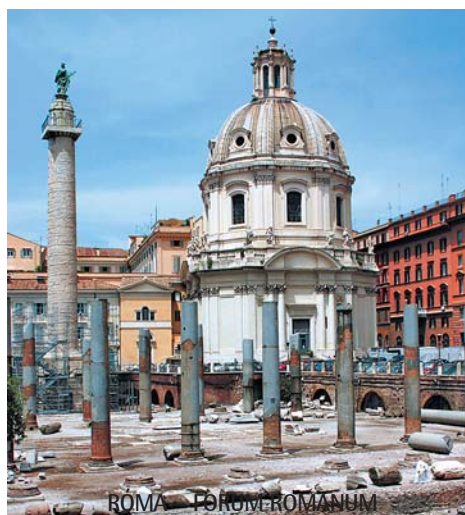
ROMA – FORUM ROMANUM

Igény esetén felárért idegenvezetőt is tudunk biztosítani!