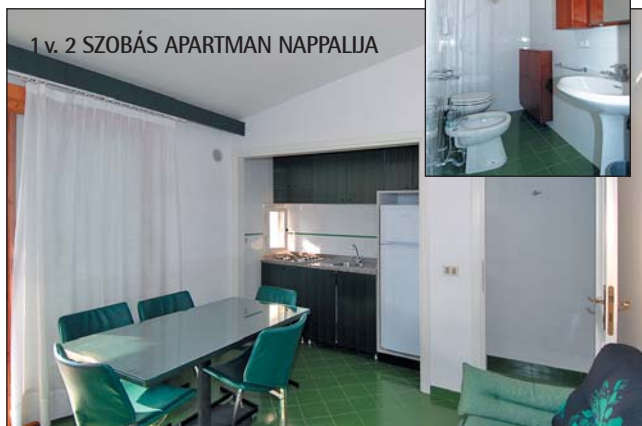
1 v. 2 SZOBÁS APARTMAN NAPPALJA