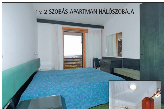
1 v. 2 SZOBÁS APARTMAN HÁLÓSZOBÁJA