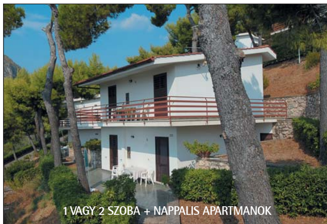
1 VAGY 2 SZOBA + NAPPALIS APARTMANOK

GPS-koordináták: N 41° 15' 47" E 13° 26' 40"